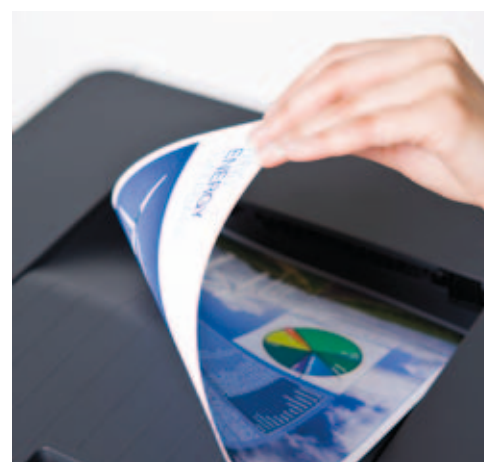
Funkcja druku dwustronnego pozwala zmniejszyć zużycie papieru.

Oferowane przez drukarkę HL-4150CDN innowacyjne i proste w użyciu rozwiązania, pozwalają obniżyć koszty i szybciej wykonywać biurowe zadania.