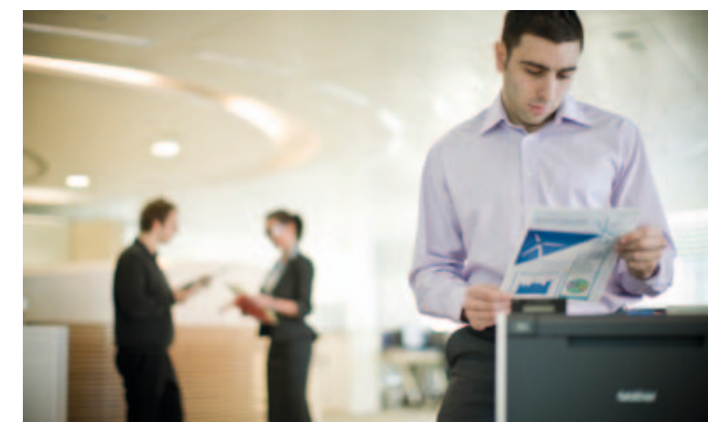
Doskonała dla ruchliwych biur: udostępniaj zasoby za pośrednictwem istniejącej sieci.