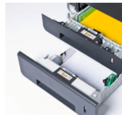
Usprawnij obsługę papieru, instalując dodatkowy podajnik